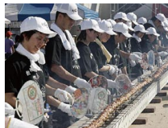
川俣シャモまつり