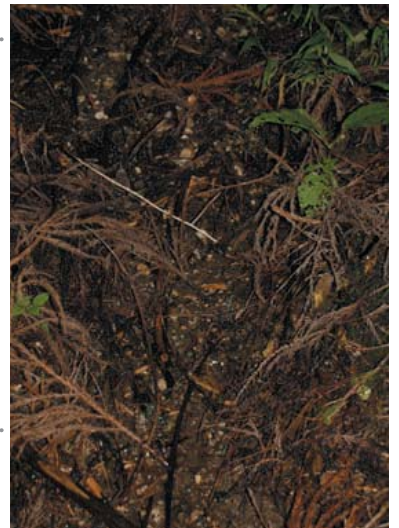
▲鎌倉岳付近の水源部