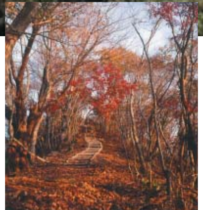
▲紅葉が美しい鎌倉岳遊歩道