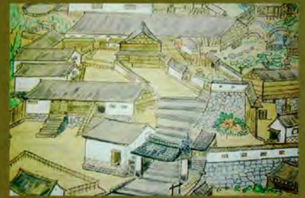
松本家本宅略図

平成18年には発掘調査が行われ、48棟あったと伝えられる蔵の基礎石や、近江八景庭園跡の全体が発見され、現在の屋敷跡は葛尾大尽屋敷跡公園として整備・公開されています。2ヘクタールに及ぶ邸宅跡には、蔵の基礎石や築城用石を用いた石垣をはじめ、近江八景を模した池、磨崖仏などが今も残り、往時を偲ばせています。